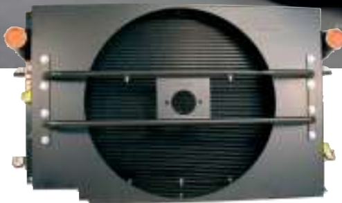
Système de refroidissement pour camping-car haut de gamme équipé d'un moteur Cummins ISX 600 CV, Country Coach