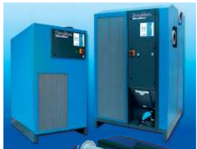
Echangeur combiné air/air de suralimentation et air/agent réfrigérant avec récupération externe de l'eau, Donaldson