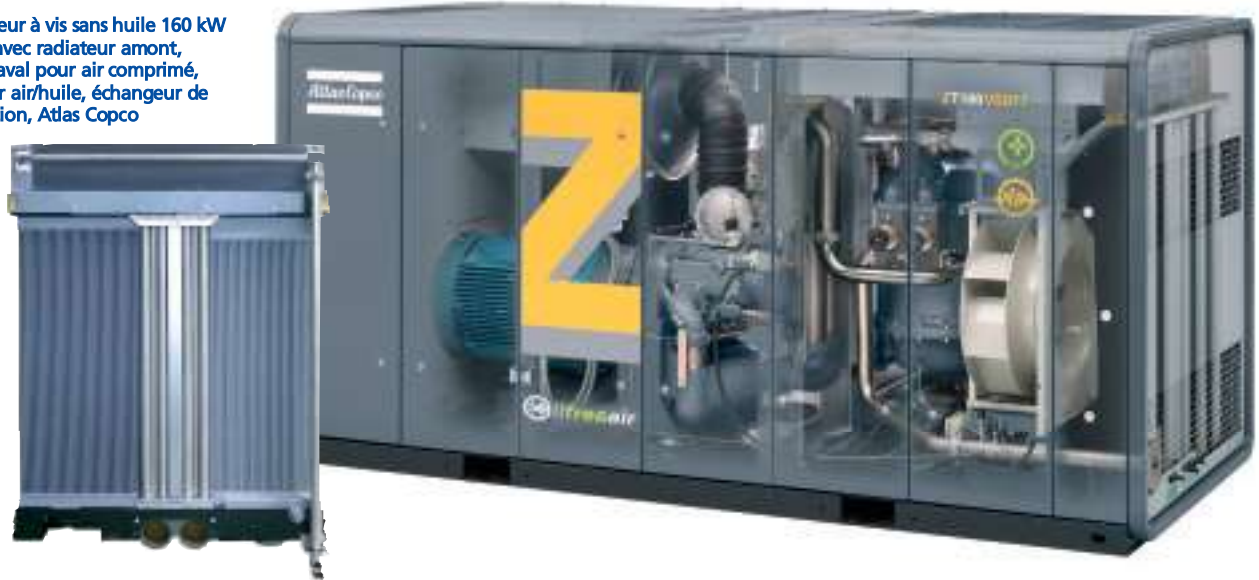
Compresseur à vis sans huile 160 kW (ZT 160), avec radiateur amont, milieu et aval pour air comprimé, échangeur air/huile, échangeur de régénération, Atlas Copco