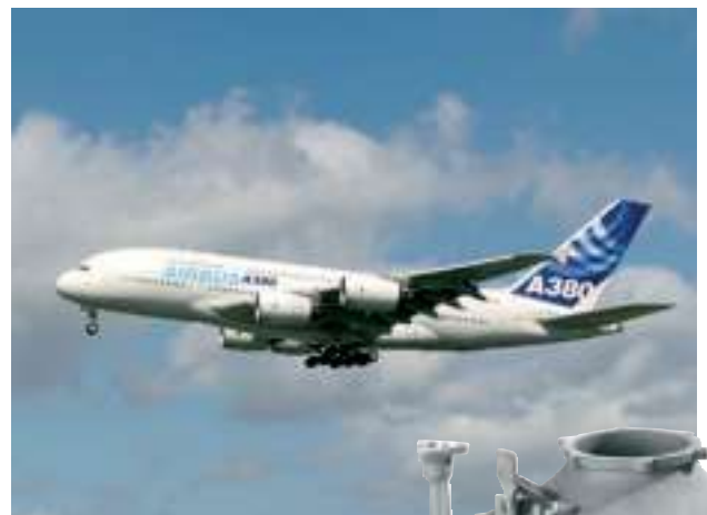
Echangeur air/eau pour groupe de refroidissement (AOA Apparatebau Gauting) installé sur Airbus A380 pour refroidissement alimentaire