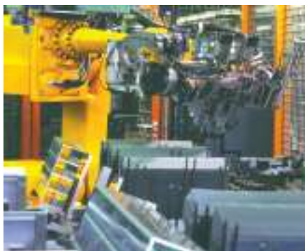
Assemblage robotisé des blocs d'échangeurs

AKG se sent concerné par la préservation de notre environnement. Tous les procédés utilisés et l'organisation de la fabrication prennent attentivement en compte le recyclage des matériaux. Les aspects économiques mais aussi écologiques sont étudiés lors de la définition des flux de matériaux et de leur circuit de recyclage.