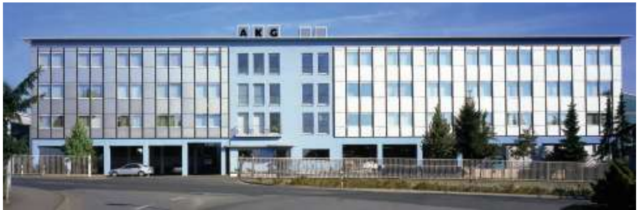
Siège principal du groupe AKG: AKG Verwaltungsgesellschaft mbH et AKG Thermotechnik International GmbH & Co. KG, Hofgeismar, Allemagne