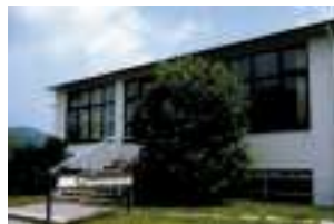
AKG Thermotechnik GmbH & Co. KG Hofgeismar, Allemagne