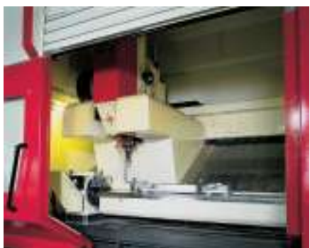
Fabrication de boîtiers