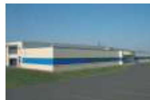
AKG Midwest, Inc. Mitchell, USA