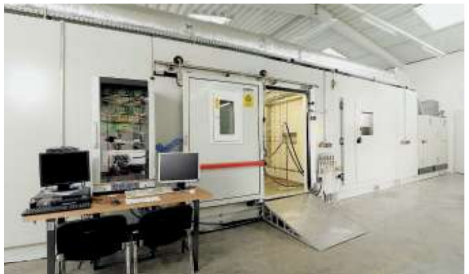
Soufflerie: détermination du rendement thermique des systèmes de refroidissement volumineux

Un ensemble de bancs d'essais permettent de vérifier en pratique les données thermiques et les propriétés mécaniques calculés.