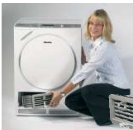
Condenseur pour sèche-linge, Miele