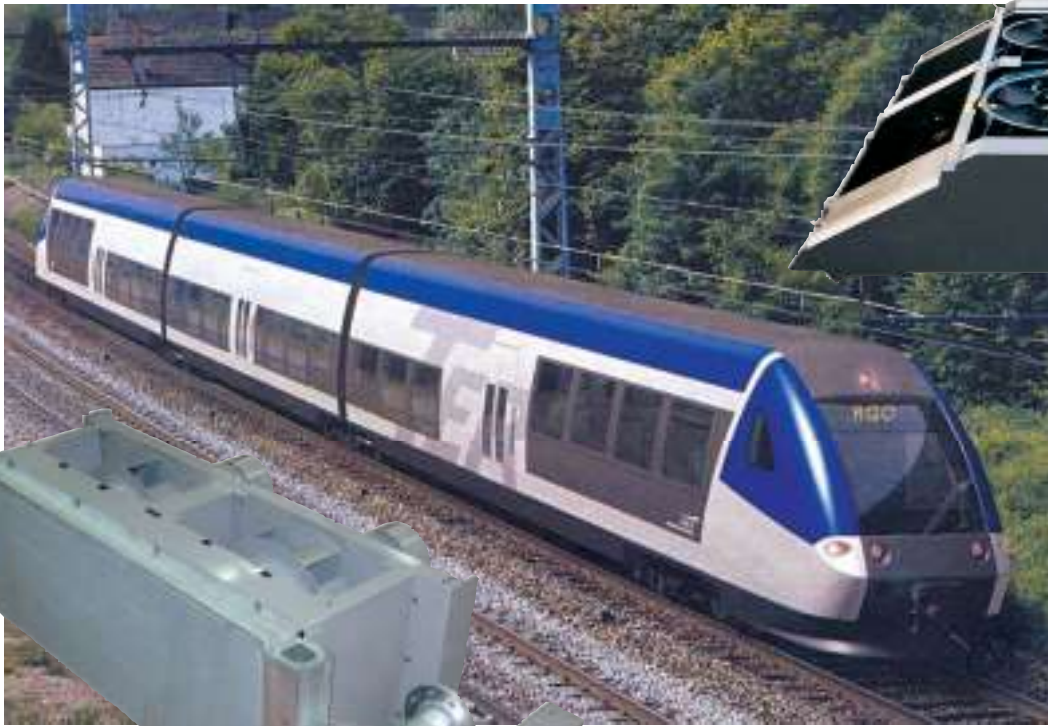
Groupe de refroidissement moteur avec circuits haute et basse températures et ventilateur haut rendement