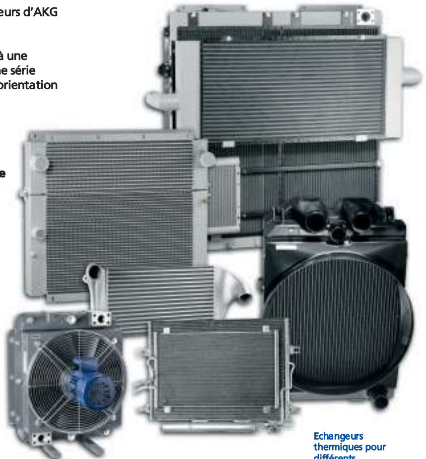
Echangeurs thermiques pour différents domaines d'application

En matière de recherche et développement les logiciels de simulation très performants CFD (Computational Fluid Dynamics) et FEM (Simulation par Éléments Finis) sont utilisés lors des phases de conception et de développement d'échangeurs thermiques à haut rendement.