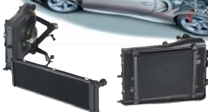
Module de refroidissement haut rendement pour le refroidissement moteur „Porsche 911 turbo“

En plus des solutions spécifiques „sur mesure“ adaptées aux cahiers des charges des clients, AKG propose toute une série de refroidisseurs standards qui trouvent leur application dans les différentes branches citées ainsi que dans de nombreux autres secteurs industriels.