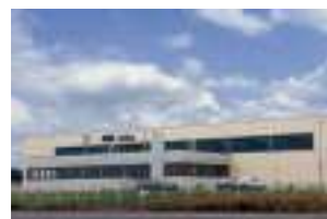
AKG France S.A.S. Sarreguemines, France