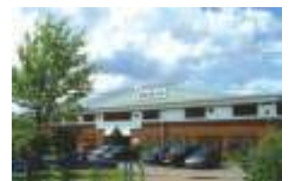
AKG UK Ltd. Tonyrefail, South Wales Grande-Bretagne