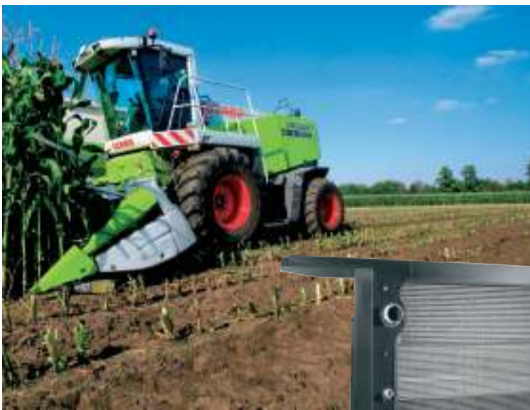
Echangeur combiné air/eau, air/air de suralimentation et air/huile pour l'ensileuse „Jaguar 900“, Claas