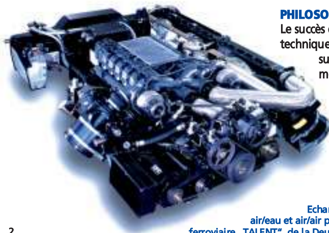
Echangeur combiné air/eau et air/air pour le véhicule ferroviaire „TALENT“, de la Deutsche Bahn AG

AKG – un groupe puissant dans le monde entier.