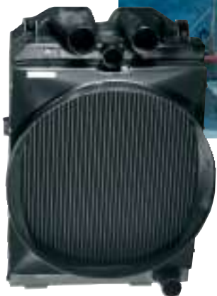
Echangeur combiné air/eau et air/air de suralimentation pour dameuse „PistenBully 600“, Kässbohrer