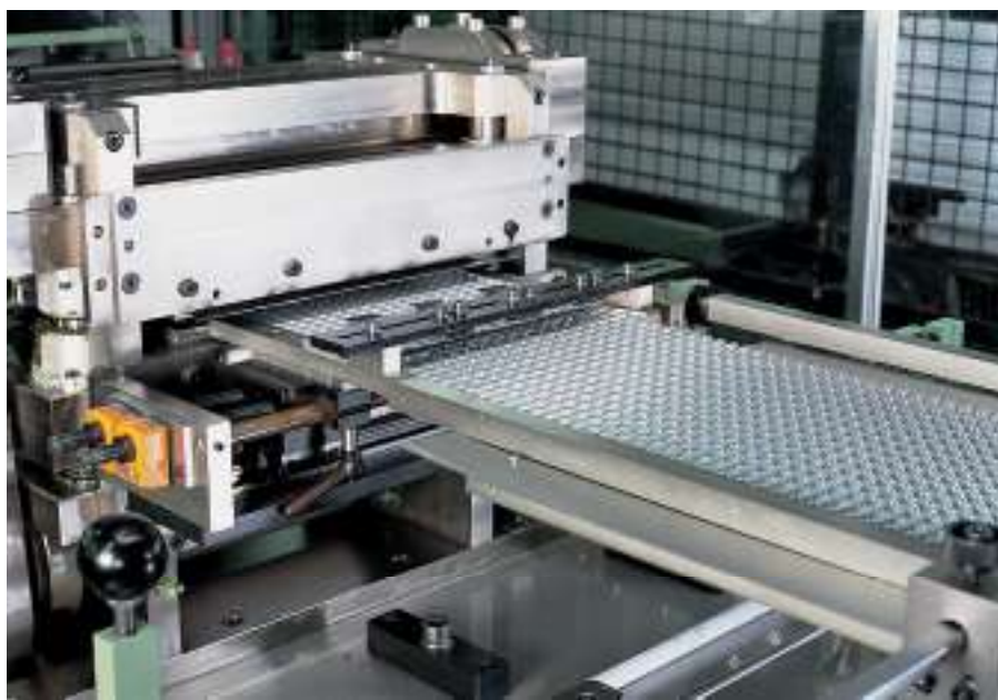
Fabrication des lamelles

Des produits innovants et toujours plus performants sont élaborés à partir de procédés de fabrication maîtrisés. Les technologies les plus récentes sont utilisées pour couvrir la grande diversité des produits. C'est particulièrement le cas pour le brasage, procédé clé pour la production des échangeurs.