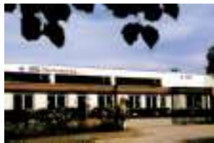
AKG Thermotechnik GmbH & Co. KG Uslar, Allemagne