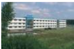
SIA AKG Thermotechnik Lettland Jelgava, Lettonie