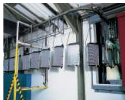
Mise en peinture électrostatique