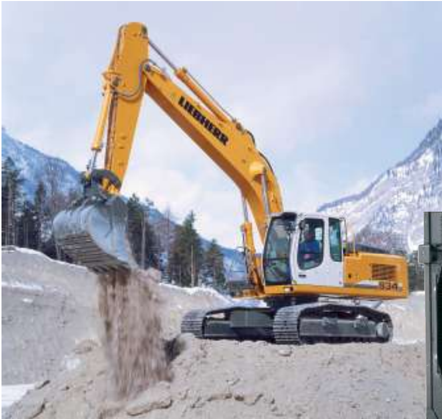
Echangeur combiné air/eau, air/air de suralimentation, air/huile hydraulique, air/huile boîte de vitesse pour Pelle „R 974 C Litronic“, Liebherr