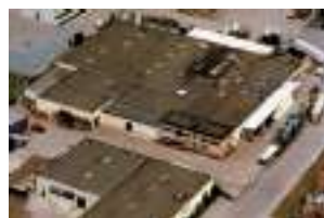
Autokühler GmbH & Co. KG Appenweiler, Allemagne