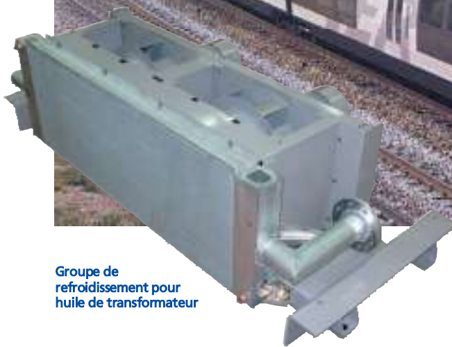
Groupe de refroidissement pour huile de transformateur