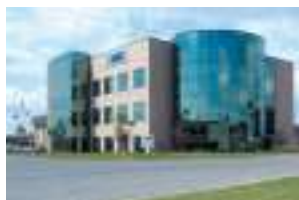
AKG of America, Inc. Mebane, USA