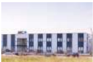
AKG Thermotechnik GmbH & Co. KG Dortmund, Allemagne