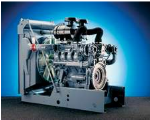
Module de refroidissement air/eau et air/air pour un groupe électrogène stationnaire, MAN