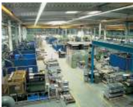
Parachèvement des échangeurs thermiques