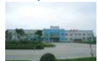
AKG Thermal Systems (Taicang) Co., Ltd., Taicang, Chine